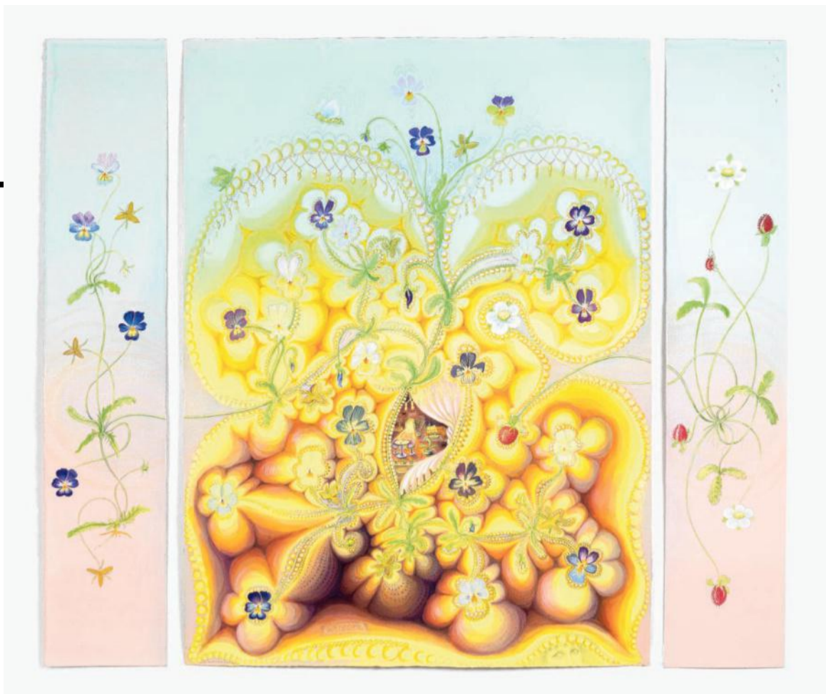
Kinke Kooi, Visit , 2019.